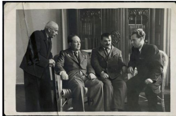
Основатели Белорусского государственного музыкального техникума (1950-е)

1925 года прагучаў фартэп’янный квінтэт М. Аладава, якому суджана было стаць роданачальнікам камерна-інструментальнага жанру ў беларускай музыцы» [1].